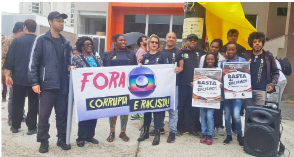
Diretores do Sindicato protestam contra a Rede Globo durante Marcha pela Consciência Negra, em Guarulhos

seu grau de investimento na Moodys e está com notas baixas na Standard & Poors e Fitch. Além disso, viu seu ativo em caixa despencar de R$3 bi para R$990 mi após financiar o golpe contra a presidenta Dilma